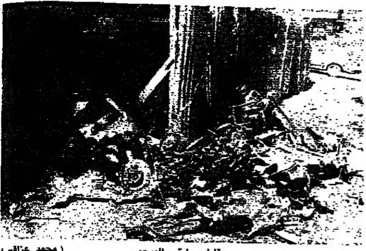
بقايا سيارة - البيجو - (محمد عزراي)